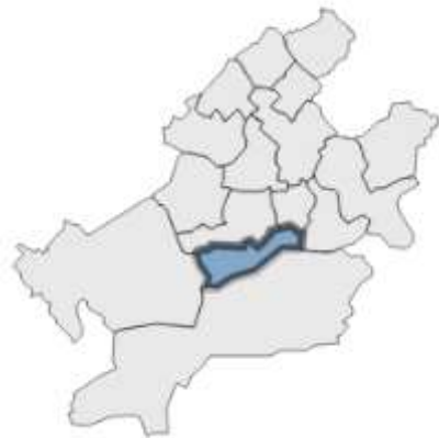
Sitzverteilung im neu gewählten Ortsbeirat 1