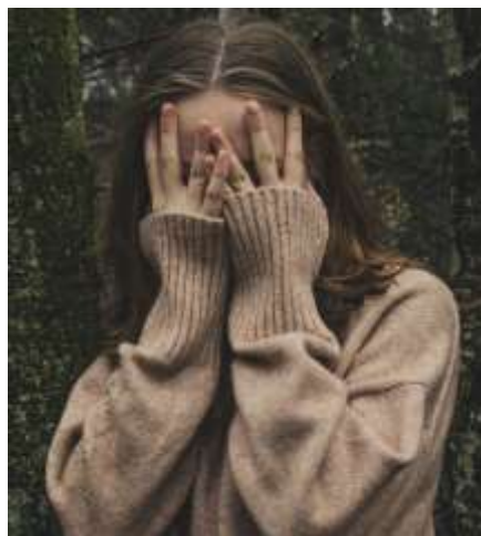
KuckKuck – Ein Kinderspiel

Und wenn wir ehrlich sind, wirkt dieses Bild auf moderne Menschen zunächst etwas fremd. Die Men-